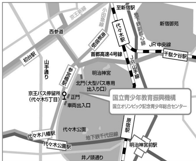
参宮橋からの[歩道橋]を使った経路